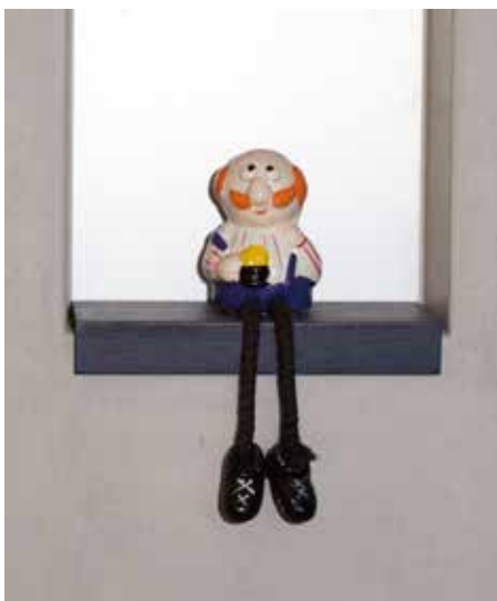
Lustiges zum Schmunzeln.

emotionalen Wert. Gerade im Kontext eines Altersheims, in dem viele Menschen mit Orientierungsschwierigkeiten oder kognitiven Einschränkungen leben, erfüllen die Nischen eine wichtige praktische Funktion. Sie dienen als visuelle Ankerpunkte und erleichtern es den Bewohnenden, ihr eigenes Zimmer wiederzufinden.