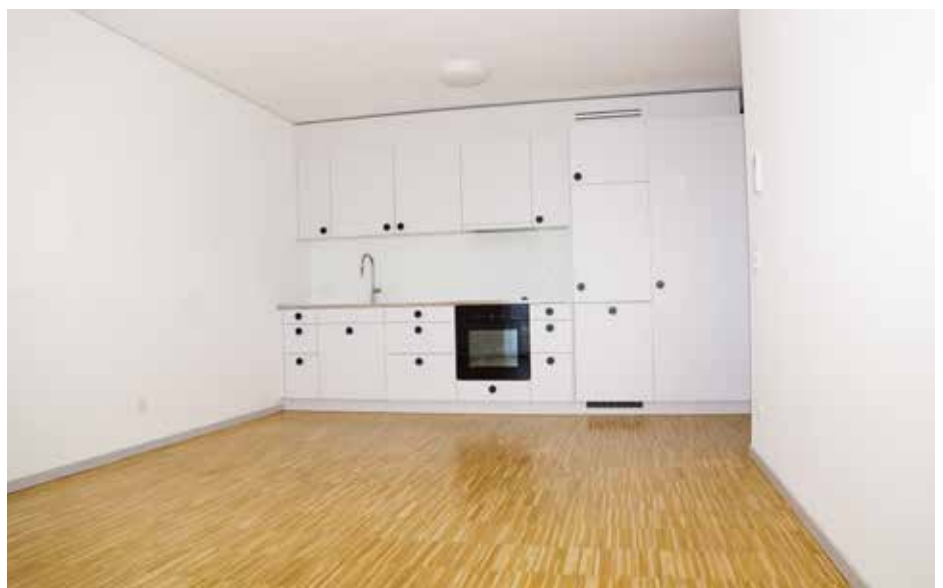
Die Küchen werden laufend ausgebaut.

Die aktuellen Mieterinnen im 4. Obergeschoss dürfen auch bei Umstellung auf einen Pflegevertrag in ihrer Wohneinheit bleiben. Ein Umzug ist nicht nötig. Die Betriebsleitung informiert laufend über die entsprechenden Massnahmen.