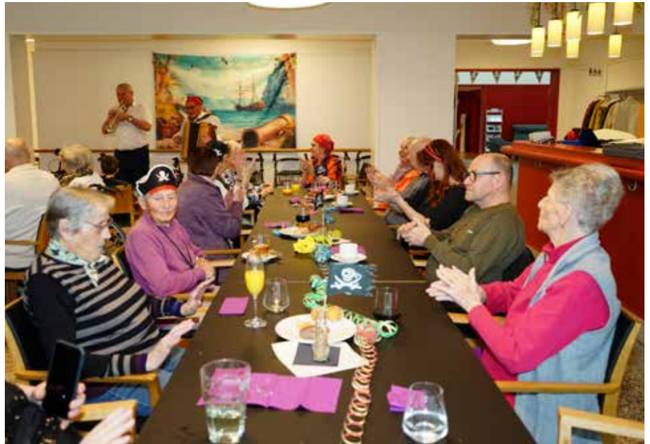
Zusammen wurde gesungen, gefeiert und gelacht.

Bewegung und luden zum Mitsingen ein. Ein weiterer Höhepunkt war der Besuch der Kita-Kinder, deren Begegnung mit den Bewohnenden viele berührende Momente schuf. Besonders beliebt waren die Maskenprämierungen: Bewohnende, Mitarbeitende und Kinder präsentierten stolz ihre fantasievollen Verkleidungen.